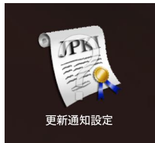
図 1. Launchpad に残存したアイコン（？マーク付き）

なお、そのまま残存させた状態で再度 JPKI 利用者クライアントソフトをインストールしても、問題ありません。